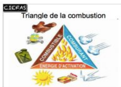
comprendre et examiner le sinistre