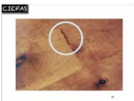
effets d'un dégât des eaux