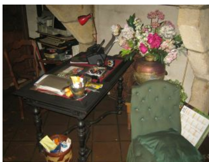
effets d'un sinistre incendie