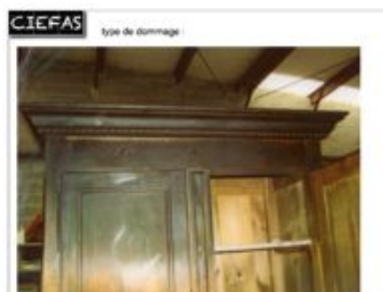
détermination des niveaux d'intervention