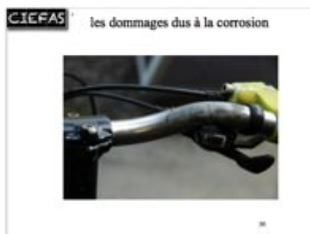
guidon de vélo en cours de traitement