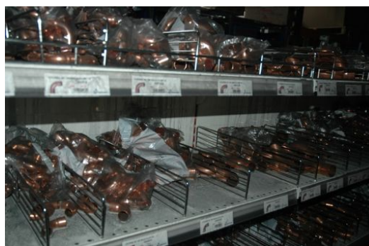
traitement de marchandises (plomberie)