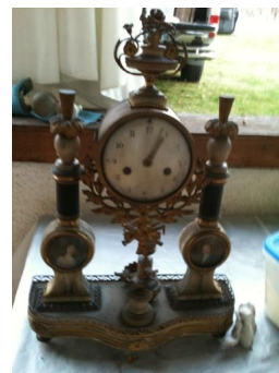
désoxydation d'une horloge ancienne